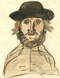
Nord Ost eller Matviads fysiomy.

— hodie vitit multum, igitur plenus est, Chabulus capiat illum damnation solutionem!